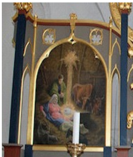
Det ene af de to billeder på N.K.Skovgaards altertavle fra 1924

Det er atter blevet vinter. Årets længste måned – november – med dens mørke, regnvejr og trøstesløshed er langt om længe blevet aflyst af forventningens glæde og julelyset i og omkring husene. Der er travlhed op mod juleaften – juletræet, julemaden, julegaver, julehilsener, juleguds-tjeneste, familiebesøg – mon vi når det hele?